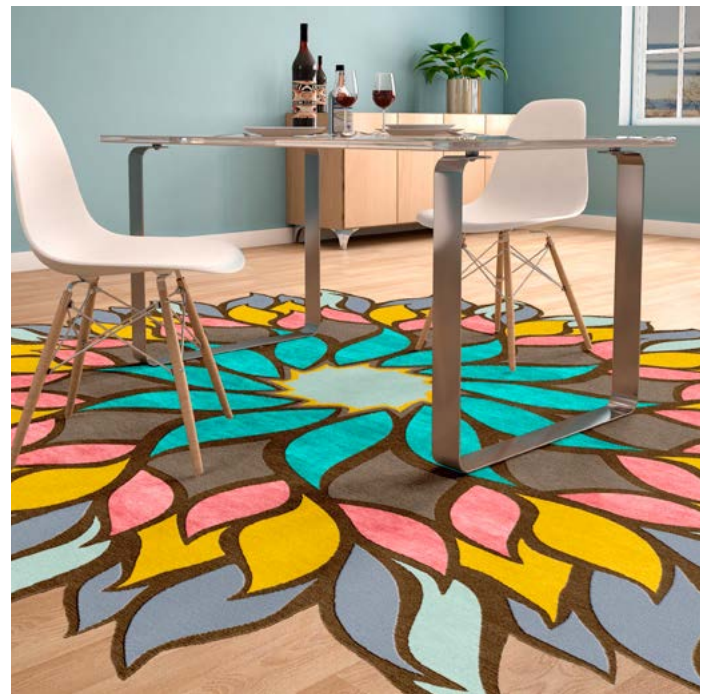
Explorug „explores“ different carpets in given rooms. Explorug zeigt, wie verschiedene Teppiche in bestimmten Räumen wirken.